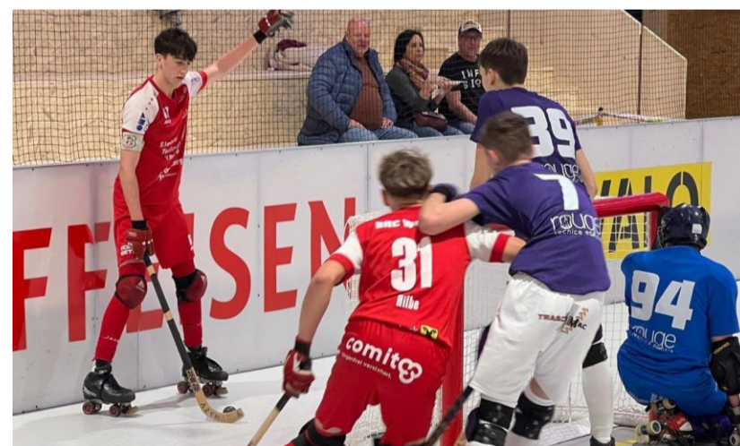
RHC Wolfurt kämpft am 8. März in Biasca um Rang sechs – ein Sieg würde den Heimvorteil in den Play-outs sichern.

Wolfurt reist dennoch mit Zuversicht ins Tessin und will mit einem starken Spiel die wichtigen Punkte mitnehmen.